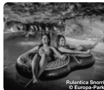
Rulantica Snorri