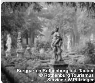
Burggarten Rothenburg o.d. Tauber

ROMANTISCHES FRANKEN Mit dem Naturpark Frankenhöhe im Norden, dem Hesselberg im Süden und vielen kleinen Dörfern, bestimmt eine weitläufige Natur das Bild der sanften Mittelgebirgslandschaft im Romantischen Franken. Das große historische Erbe zeigt sich in den ehemaligen Reichsstädten, den früheren Klöstern und in der Markgrafenresidenz Ansbach. Die Städte im Romantischen Franken sind Glanzpunkte deutscher Städtebaukunst. Beeindruckende Fachwerkhäuser, geschlossene Stadtmauern, verwinkelte Gassen, Tore und Türme aus dem Mittelalter bestimmen die Stadtbilder. Die berühmte alte Reichsstadt Rothenburg ob der Tauber thront hoch über dem Fluss und ist Romantik pur. TreffpunktDeutschland.de/romantisches-franken