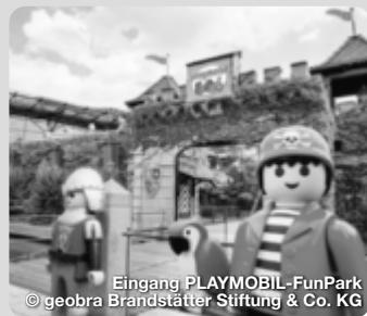
Eingang PLAYMOBIL-FunPark