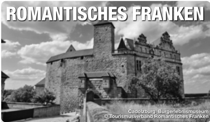
Cadolzburg Bürgerlebnismuseum

Reiseführer. Reisemagazine. Freizeittipps. Alle Termine und Angaben unter Vorbehalt!