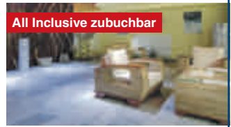
All Inclusive zubuchbar

Einzelzimmerzuschlag: 20 €/Nacht Kurtaxe: ca. 2,10 € p. P./N. Auch 7 Nächte sowie weitere Termine 2024 buchbar.