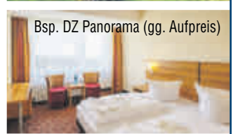
Bsp. DZ Panorama (gg. Aufpreis)